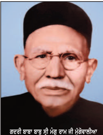
ਗਦਰੀ ਬਾਬਾ ਬਾਬੂ ਸ਼੍ਰੀ ਮੰਗੂ ਰਾਮ ਜੀ ਮੁੱਗੋਵਾਲੀਆ

ਅੱਜ ਯੁੱਗ ਬਦਲ ਗਿਆ ਹੈ। ਮਨੁੱਖ ਆਪਣੇ ਕਰਤਵਾਂ ਤੇ ਅਧਿਕਾਰਾਂ ਨੂੰ ਸਮਝਦਾ ਹੈ। ਮਾਨਵੀ ਕਦਰਾਂ-ਕੀਮਤਾਂ ਵਿਚ ਬੜੀ ਤਬਦੀਲੀ ਆਈ ਹੈ। ਮਨੁੱਖ ਦੀ ਵਿਗਿਆਨਕ ਸੋਚ ਨੇ ਮਾਨਵਵਾਦ ਤੇ ਅੰਤਰ ਰਾਸ਼ਟਰਵਾਦ ਨੂੰ ਜਨਮ ਦਿੱਤਾ ਹੈ ਜੋ ਮਾਨਵ ਅੱਜ ਦੇ ਅਜਿਹੇ ਯੁੱਗ ਵਿਚ ਜਾਤ-ਪਾਤ ਦੀ ਗੱਲ ਕਰਦਾ ਹੈ, ਉਹ ਮਾਨਵ ਨਹੀਂ ਹੈ। ਇਕ ਹੈਵਾਨ ਹੈ। ਇਹੀ ਸੋਚ ਆਉਣ ਵਾਲੇ ਸਮੇਂ ਵਿਚ ਤਬਦੀਲੀ ਦੀ ਸੂਚਕ ਹੈ। ਵੈਸੇ ਵੀ ਸੋਚਿਆ ਜਾਵੇ ਤਾਂ ਜਾਤੀ ਵਾਚਕ ਸ਼ਬਦਾਂ ਦੀ ਕੀ ਵੱਕਤ ਹੈ। ਇਹ ਸਿਰਫ ਸ਼ਬਦ ਹੀ ਹਨ ਇਨ੍ਹਾਂ ਦੀ ਅਜੋਕੇ ਵਿਗਿਆਨਕ ਯੁੱਗ ਵਿਚ ਕੋਈ ਸਾਰਥਿਕਤਾ ਨਹੀਂ ਹੈ। ਅੱਜ ਦਾ ਮਨੁੱਖੀ ਸਮਾਜ ਇੰਨੀ ਤਰੱਕੀ ਕਰ ਗਿਆ ਹੈ ਕਿ ਵਿਗਿਆਨ ਦੀਆਂ ਕਾਢਾਂ ਨੇ ਨਵੇਂ-ਨਵੇਂ ਕਿੱਤਿਆਂ ਨੂੰ ਜਨਮ ਦਿੱਤਾ ਹੈ ਤੇ ਮਨੁੱਖ ਆਪਣੇ ਜੱਦੀ-ਪੁਸ਼ਤੀ ਕਿੱਤਿਆਂ ਨੂੰ ਛੱਡੀ ਜਾ ਰਿਹਾ ਹੈ ਤੇ ਉੱਚ ਵਰਗ ਦੇ ਕਹੇ ਜਾਣ ਵਾਲੇ ਲੋਕ ਇਨ੍ਹਾਂ ਛੱਡੇ ਗਏ ਕਿੱਤਿਆਂ ਨੂੰ ਅਪਣਾਈ ਜਾ ਰਹੇ ਹਨ, ਜਿਹਨਾਂ ਨੂੰ ਉਹ ਘਟੀਆ ਕਿੱਤੇ ਸਮਝਦਾ ਸੀ। ਇੱਥੇ ਇਕ ਸਵਾਲ ਪੈਦਾ ਹੁੰਦਾ ਹੈ ਕਿ ਕੀ ਨਿਮਨ ਵਰਗ ਕਹੇ ਜਾਣ ਵਾਲੇ ਲੋਕਾਂ ਦੇ ਕਿੱਤੇ, ਜੋ ਅੱਜ ਆਪਣੇ ਆਪ ਨੂੰ ਉੱਚ ਵਰਗ ਸਮਝਣ ਵਾਲੇ ਲੋਕ ਅਪਣਾ ਰਹੇ ਹਨ, ਇਨ੍ਹਾਂ ਕਿੱਤਿਆਂ ਨੂੰ ਆਪਣੀ ਜਾਤ ਕਹਿਲਾਉਣ ਲਈ ਤਿਆਰ ਹਨ? ਇਸ ਦਾ ਉਤਰ ਸ਼ਾਇਦ ਨਹੀਂ ਹੋਵੇਗਾ ਤੇ ਫਿਰ ਕਿਸੇ ਦੇ ਕਿੱਤੇ ਨੂੰ ਜਾਤ ਕਿਉਂ ਸਮਝਿਆ ਜਾਵੇ ਸਗੋਂ ਮਨੁੱਖ ਦੀ ਜਾਤ ਮਨੁੱਖਤਾ ਹੀ ਹੈ। ਜਦੋਂ ਮਾਨਵ ਜੰਗਲਾਂ ਵਿਚ ਰਹਿੰਦਾ ਸੀ ਤੇ ਉਹ ਇਕ ਸੱਭਿਅਤ ਮਾਨਵ ਅਜੇ ਨਹੀਂ