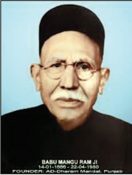
BABU MANGU RAM JI 14-01-1886 - 22-04-1980 FOUNDER: AD-Dharam Mandali, Punjab