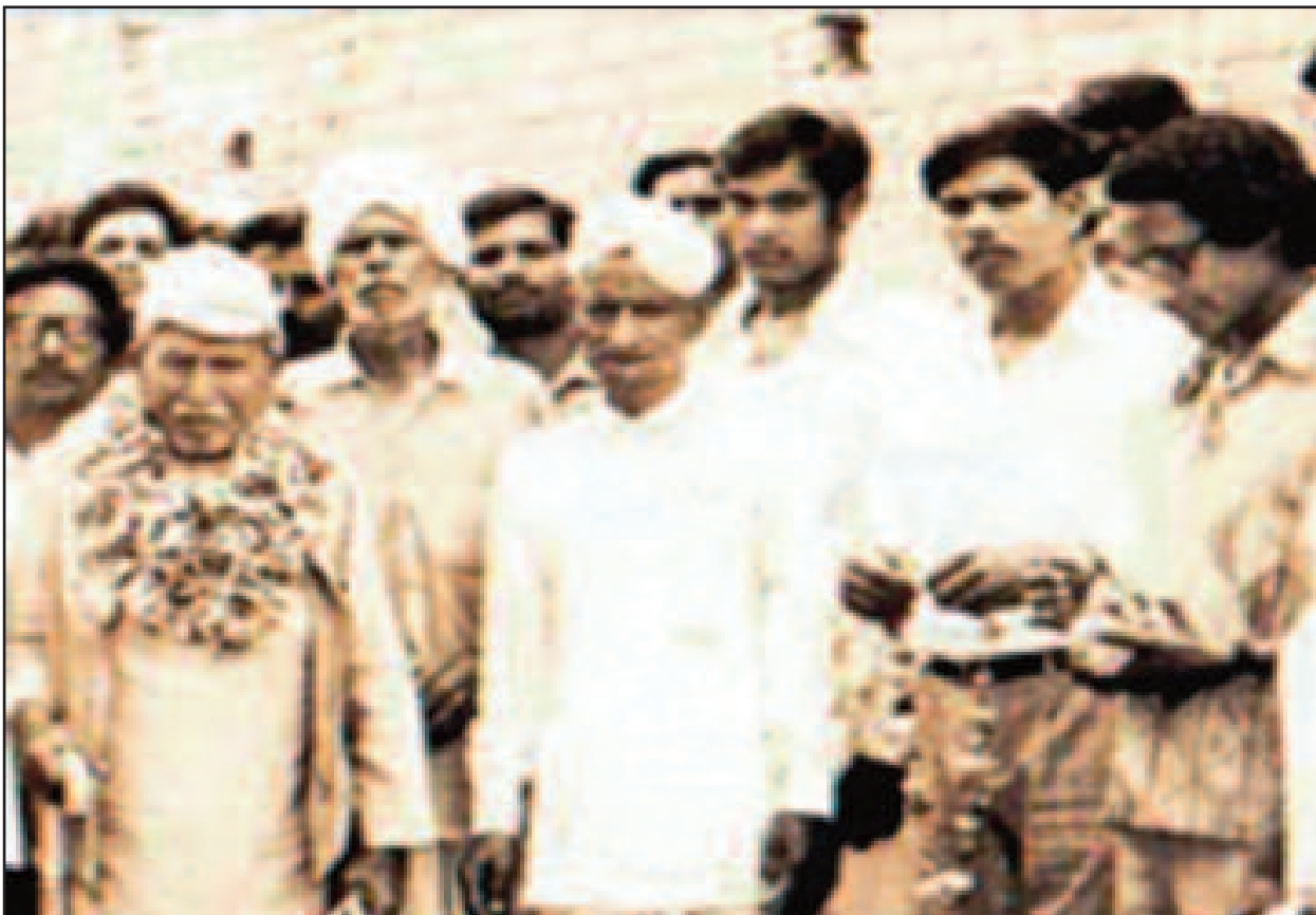
ਬਾਬੂ ਮੰਗੂ ਰਾਮ ਮੁੱਗੋਵਾਲੀਆ ਨਾਲ ਲੇਖਕ ਦੀ 1975 ਦੀ ਇਕ ਤਸਵੀਰ

1975 ਵਿਚ ਹੀ ਕੁਝ ਘੜੰਮ ਚੌਧਰੀ ਸਿਆਸਤਦਾਨਾਂ ਵਲੋਂ ਆਦਿ ਧਰਮ ਮੰਡਲ ਦੀ 50ਵੀਂ ਵਰ੍ਹੇ-ਗੰਢ ਉੱਪਰ ਪ੍ਰਕਾਸ਼ਿਤ ਕੀਤੇ ਇਕ ਸੋਵੀਨਰ ਲਈ ਵੱਡੇ-ਵੱਡੇ ਆਗੂਆਂ ਵਲੋਂ ਮੰਗਵਾਏ ਗਏ ਸੰਦੇਸ਼ਾਂ ਰਾਹੀਂ ਲਿਖ ਕੇ) ਬਾਬੂ ਜੀ ਨੂੰ ਇਕ ਵਾਰੀ ਫਿਰ 'ਚੜ੍ਹਾਈ ਕਰ ਗਿਆ' ਘੋਸ਼ਿਤ ਕੀਤਾ ਗਿਆ, ਹਾਲਾਂਕਿ ਜਿਸ ਸਮਾਗਮ 'ਤੇ ਇਹ ਸੋਵੀਨਰ ਰਿਲੀਜ਼ ਕੀਤਾ ਗਿਆ, ਉੱਥੇ ਖੁਦ ਬਾਬੂ ਮੰਗੂ ਰਾਮ ਮੁੱਗੋਵਾਲੀਆ ਮੌਜੂਦ ਸਨ। ਮੈਨੂੰ ਇਸ ਗੱਲ ਦਾ ਵੀ ਵਿਸ਼ੇਸ਼ ਦੁੱਖ ਹੈ ਕਿ 1980 ਵਿਚ ਬਾਬੂ ਜੀ ਦੀ ਅੰਤਮ ਸ਼ੋਕ ਸਭਾ 'ਤੇ ਵਿਸ਼ੇਸ਼ ਸੱਦਾ ਪੱਤਰ ਭੇਜੇ ਜਾਣ ਦੇ ਬਾਵਜੂਦ ਵੀ ਆਦਿ ਧਰਮ ਮੰਡਲ ਰਾਹੀਂ ਸਿਆਸੀ ਤਾਕਤ ਹਾਸਲ ਕਰਨ ਵਾਲਿਆਂ ਵਿਚੋਂ ਕੋਈ ਵੀ ਘੜੰਮ ਚੌਧਰੀ ਉਨ੍ਹਾਂ ਨੂੰ ਸ਼ਰਧਾ ਦੇ ਫੁੱਲ ਭੇਂਟ ਕਰਨ ਲਈ ਉਨ੍ਹਾਂ ਦੇ ਨਿਵਾਸ-ਸਥਾਨ, ਗੜਸ਼ਕਰ ਵਿਖੇ ਨਹੀਂ ਪਹੁੰਚਾ। ਆਪਣੀ ਯੂ.ਕੇ. ਯਾਤਰਾ ਦੌਰਾਨ, ਵਿਸ਼ੇਸ਼ ਕਰਕੇ ਆਦਿ ਧਰਮ ਬ੍ਰਦਰਹੁਡ ਅਤੇ ਸ਼੍ਰੀ ਗੁਰੂ ਰਵਿਦਾਸ ਧਾਰਮਿਕ ਸਭਾ ਵਲਵਰਹੈਪਟਨ ਦੀਆਂ ਵਿਸ਼ੇਸ਼ ਇਕਤੁਤਾਵਾਂ ਵਿਚ ਜਾ ਕੇ ਮੈਨੂੰ ਖੁਸ਼ੀ ਹੋਈ ਕਿ ਬਾਬੂ ਜੀ ਹਾਲੇ ਵੀ ਉਨ੍ਹਾਂ ਦੇ ਦਿਲੋ-ਦਿਮਾਗ ਵਿਚ ਜ਼ਿੰਦਾ ਹਨ। ਮੈਂ ਉਸ ਮਹਾਨ ਯੋਧੇ ਨੂੰ ਪ੍ਰਣਾਮ ਕਰਦਾ ਹਾਂ!